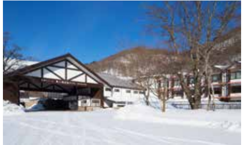
抵達奧入瀨溪流酒店登記