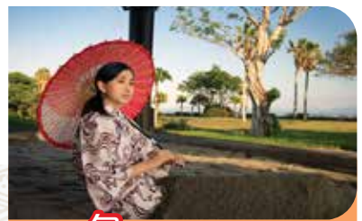
多包一次砂蒸溫泉體驗