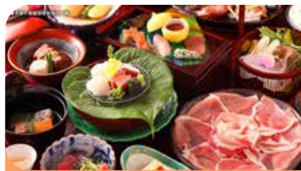
晚餐為會席料理，品嚐鹿兒島黑豚